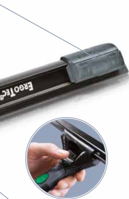
Mecanismo de seguridad de guías TriLoc

Protección del marco: Para proteger los marcos de las ventanas de arañazos. Los SmartClips se pueden sustituir fácilmente con la mano o con un destornillador.